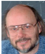
Prof. Bjarne Stroustrup, père du C++

I have always wished that my computer would be as easy to use as my telephone... My wish has come true: I no longer know how to use my telephone.